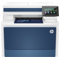
Impressora HP Color LaserJet Pro MFP 4303dw

Essa impressora destina-se a funcionar somente com cartuchos que tenham um chip da HP novo ou reutilizado e aplica medidas de segurança dinâmica para bloquear cartuchos que usem um chip de terceiros. As atualizações periódicas de firmware manterão a eficácia dessas medidas e bloquearão cartuchos que funcionaram anteriormente. Um chip da HP reutilizado permite a utilização de cartuchos reutilizados, remanufaturados e recarregados. Para mais informações, acesse a: http://www.hp.com/learn/ds