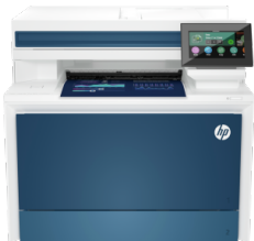
Impressora HP Color LaserJet Pro MFP 4303fdw